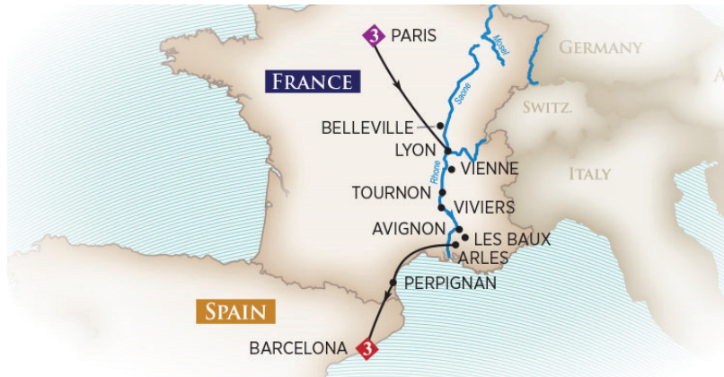
Reiseroute „Amadagio“

Beide Schiffe verrichteten ihren Dienst im Jahr 2016 ausschließlich in Frankreich. Während die „Amadagio“ auf der Rhône im Einsatz war, befuhr die „Amalegro“ die Seine.